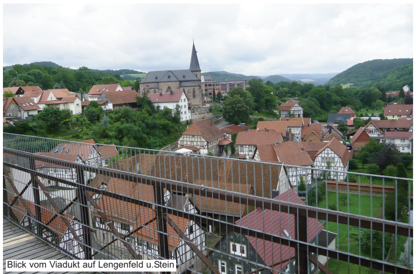
Blick vom Viadukt auf Lengenfeld u. Stein