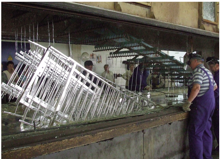
Arbeiter bei der Entnahme der zu verzinkenden Bauteile aus dem Zinkbad